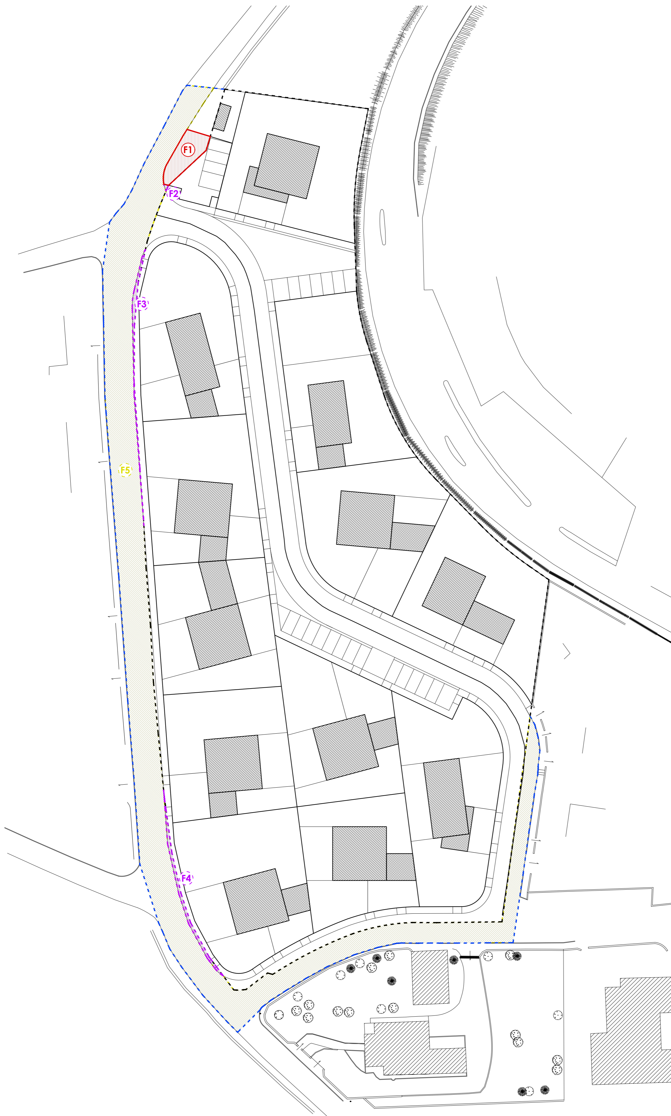
PLANIMETRIA GENERALE SCALA 1:500